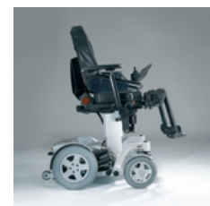
1030 / 1040