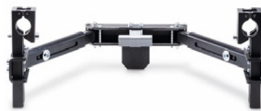
1595020 - Kit Fixação standard

* o Via GO não está equipado com travão, pelo que é recomendado que a cadeira de rodas esteja equipada com travão de acompanhante e rodas anti-volteio