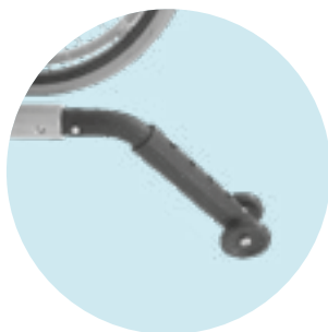
MA 55 / MA 56