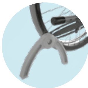
MA 61 / MA 62