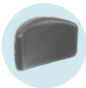
MD 23 / MD 24