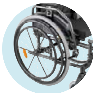
MG83 Acionamento hemiplégico