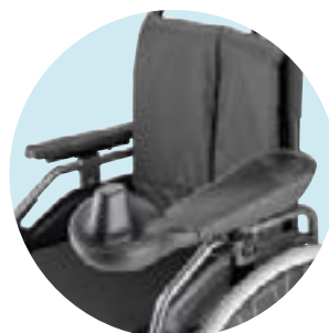
ME72+80 Apoio de braço com apoio de mão cônico