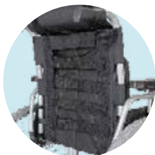
MD19 Estofa encosto Economy Ergo