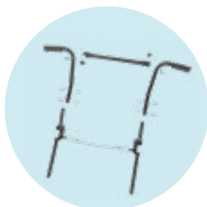
MD10 Encosto regulável em ângulo 30°