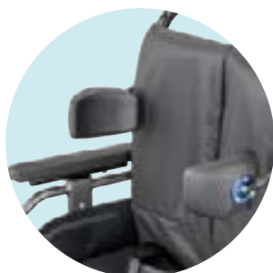
MD23 Suporte torácico