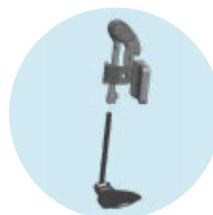
MB25/26/27 Patim para amputado