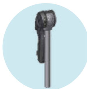
MB21/22/23 Patim elevatório