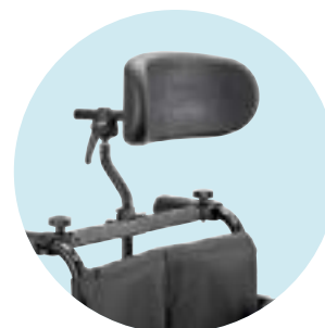
MZ63 Apoio de cabeça + kit de montagem