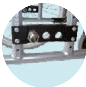
Adaptador roda traseira Chassis Flex