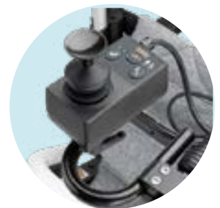
EU 15 Comando de acompanhante