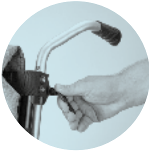
ED 10 Punho reg. em altura, destacável