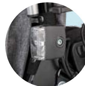
ES 06 Iluminação completa