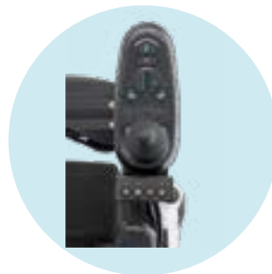
EU 20 Suporte de comando, articulado em paralelo