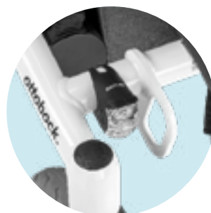
EU 08 Luz básica para caminhos