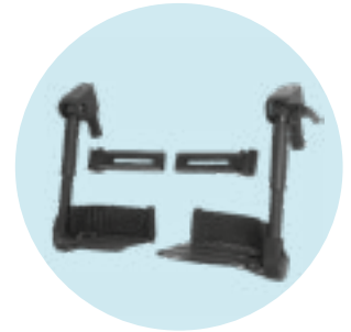
EB 20 Patins elevatórios