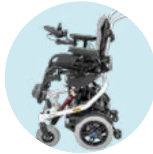
EC 57 Regulação de altura de assento