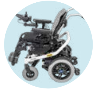
ED 50 Reclinação elétrica de encosto