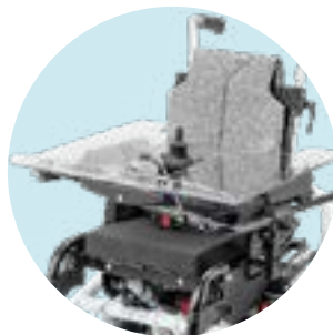
EU 06 Comando para mesa