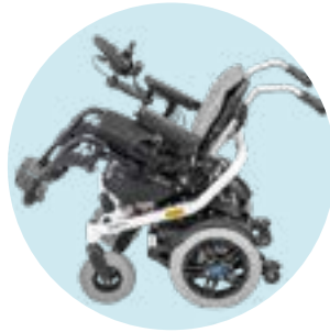
EC 50 Basculação elétrica