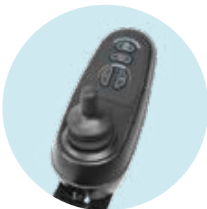
EU 85 Comando standard