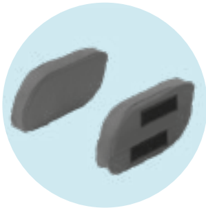
EE 37 Almofadas laterais