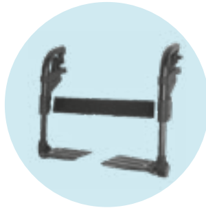
EB 02 Patim em duas peças