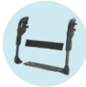
EB 05 Patim único