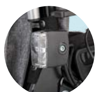
ES 06 Iluminação completa