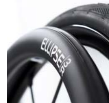
XFF070212 Ellipse 3R