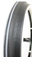
XFF070208 Aros Maxgrepp