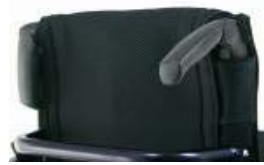
XFF 030203 Punhos dobráveis