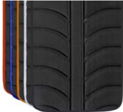
Cores frias tecidos EXO EVO