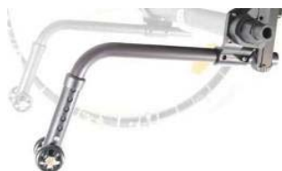
XFF090050 Rodas antivoltio não rebatíveis