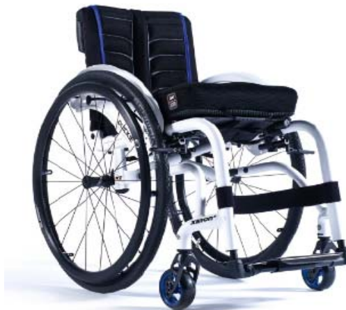
XFF090020 / 21 Estrutura híbrida reforzada