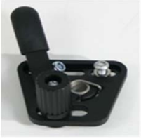
XFF060001 Travão standard