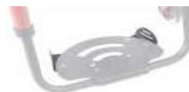
XFF050127 Posicionadores de pés para plataforma