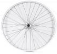
XFF070001 Rodas traseiras com raios cruzados