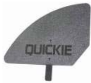
XFF040107 Protector de plástico desmontável