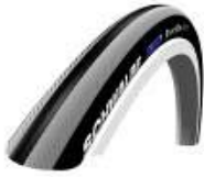
XFF070101 Pneus Alta pressão lisa Right Run