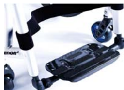
XFF0500132 Plataforma única de fibra de carbono