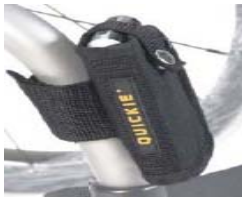
XFF090026 Suporte telemóvel