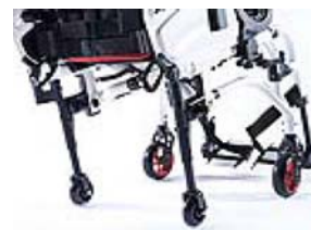
XFF090010 Rodas de trânsito