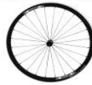
XFF07000 Rodas Proton (ultraligeiras)