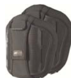
Torácico Médio (MT)