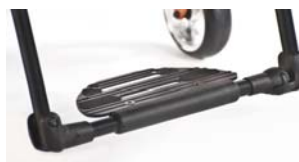
XFF050059 Plataforma de alumínio Xenon performance