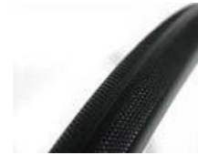
XFF070102 Pneus maciças