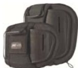
Torácico Inferior (LT)