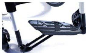
XFF050027 Plataforma auto-dobrável de carbono