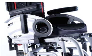
XFF04000x Apoios de braço de escritório