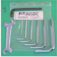
XFF090000 Kit de ferramentas