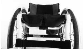
XFF 020003 Tecido do assento com 2 bolsas