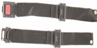
XFF 090018 Cinto de posicionamento com fecho