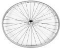
XFF070002 Rodas traseiras de desenho