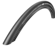
XFF070107 Pneus Schwalbe One