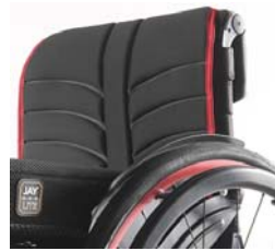
XFF 030316 Tecido do encosto EXO EVO