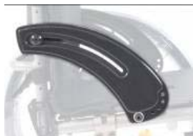
XFF040101 Protector simples pequeno