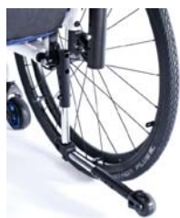
XFF090004 Rodas antivoltio rebatíveis