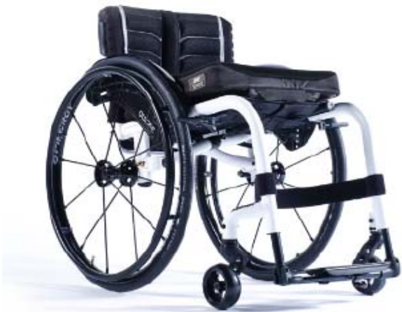
XFF010012 / 13 Armação com apoios de pés fixos