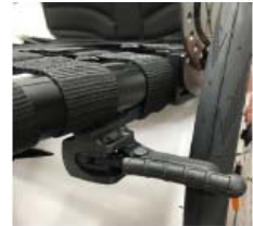
XFF060024 Travão compacto ligeiro EVO