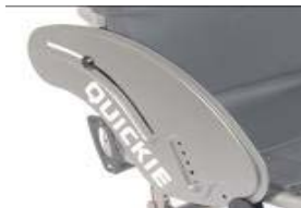
XFF040102 Protector lateral de alumínio sem guarda lamas