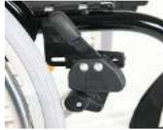
XFF060002 Travão de rodilha (montado alto)