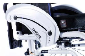
XFF040103 Protector lateral de alumínio com guarda lamas