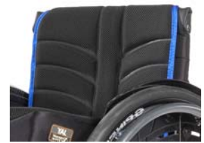
XFF 030317 Tecido do encosto EXO EVO PRO