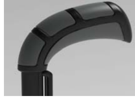
XFF 030201 Punhos standard largos