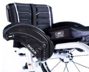
XFF040104 Protector lateral de carbono com guarda lamas