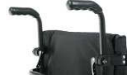
XFF 030204 Punhos ajustáveis em altura