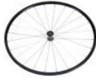
XFF070003 Rodas traseiras ligeiras