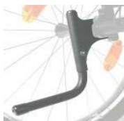
XFF090001 Ajuda p/subir passeio