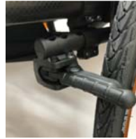
XFF060023 Travão compacto EVO