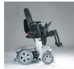
1030 / 1040