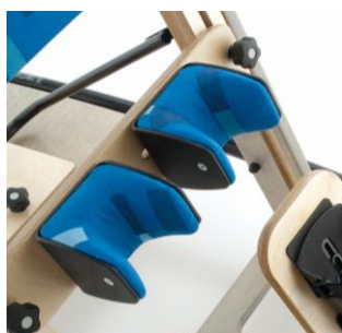
Suporte de joelhos acolchoado