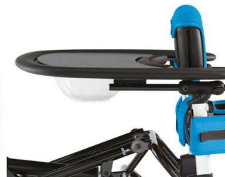
Mesa com cavidade