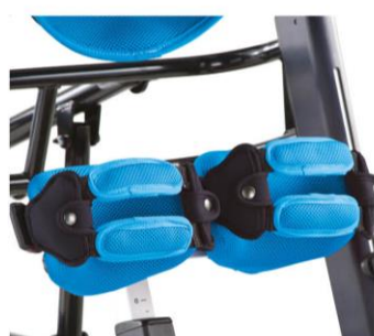
Cintos divididos para joelhos