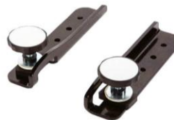
Extensão altura de joelhos