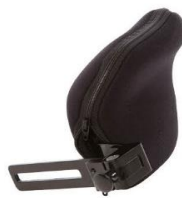
Suporte Articulado Vertical