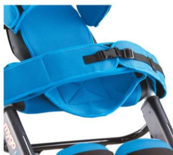
Cinto desrotação de anca em Supino