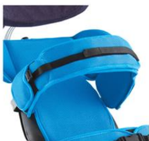
Cinto Torácico / Pélvico