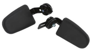
Suporte Lateral fixo