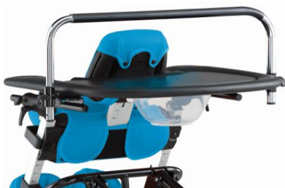
Arco de fixação