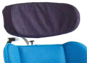
Apoio de cabeça