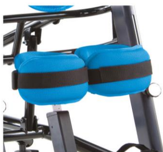
Cintos standard para joelhos