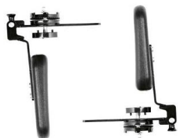
Suporte Lateral abatível