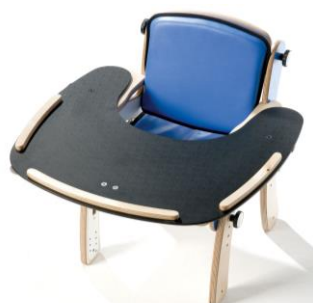
Mesa de terapia