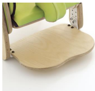
Placa para pés