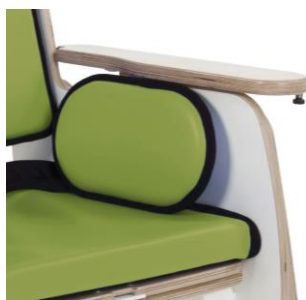
Estofa pélvico almofadado