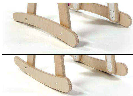
Perna com suporte