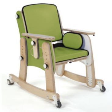
Perna com rodízios