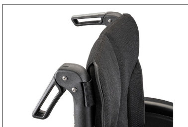
MD56 Punhos rebatíveis