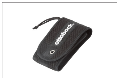
MZ59 Bolso para telemóvel