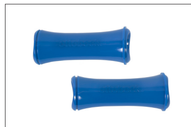
MZ89 Proteção para eixos de extração rápida