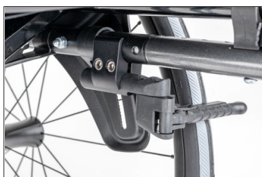
MH05 Travão de tesoura