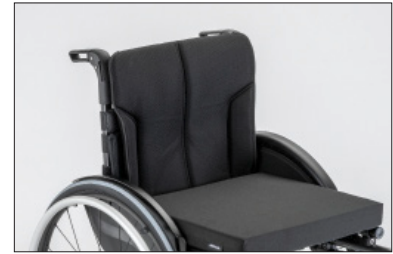
MD05 Estofa de encosto, transpirável