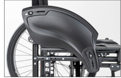
ME02 Resguardo lateral com protetor de roupa e contra o frio