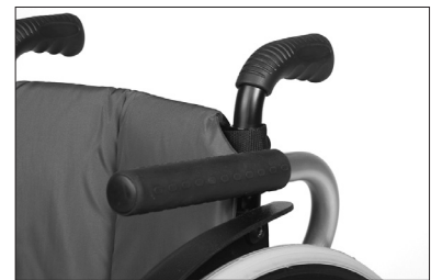
ME50 Apoio de braço, almofadado