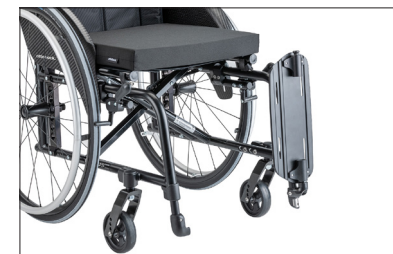
MB201 Placa de patim articulada, esquerda