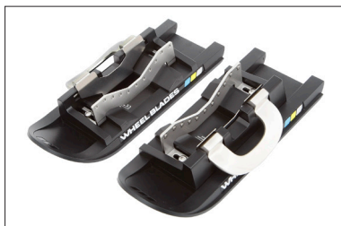
MZ92 Wheelblades (Mini skis)