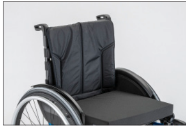
MD03 Estofa de encosto, almofadado