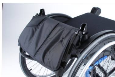
MD11 Encosto dobrável