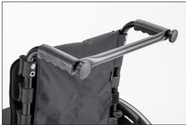
MD58 Barra estabilizadora