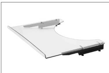
ME60 Mesa de terapia