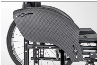
ME04 Resguardo lateral de carbono