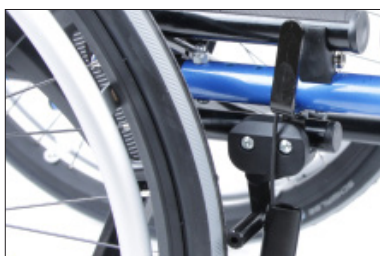
MH01 Travão de manípulo