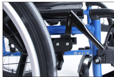
MH10 Prolongamento do manípulo de travão