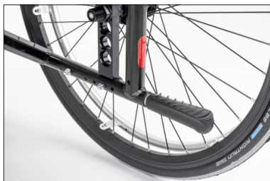
MA51 Auxiliar de inclinação