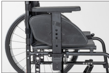
ME11 Resguardo lateral com apoio de braço destacável