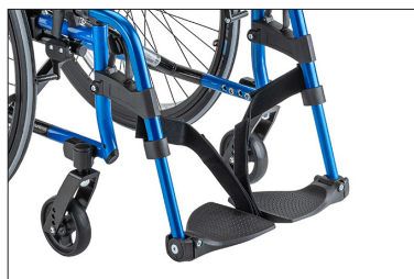
MB10 Patim em duas peças, placas reguláveis em ângulo e rebatíveis