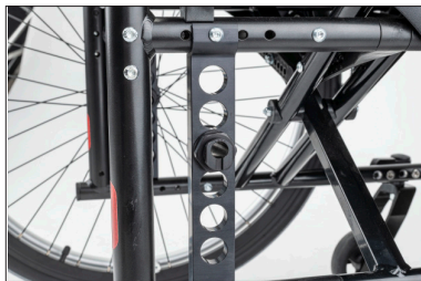
Adaptador de roda traseira