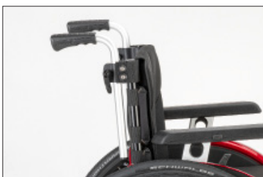
MD55 Punhos reguláveis em altura, destacáveis