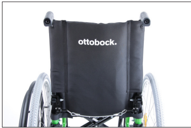
MD04 Estofa de encosto standard