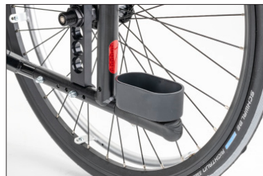
MA57 Porta bengala