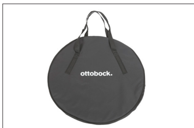
MZ58 Bolsa para rodas traseiras