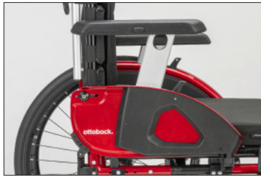
ME17 Resguardo lateral com apoio de braço longo, regulável em altura