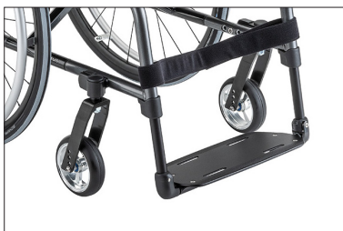
MB03 Patim único, regulável em ângulo