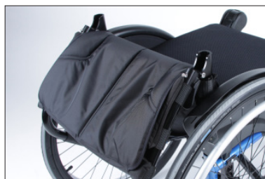
MD11 Encosto dobrável