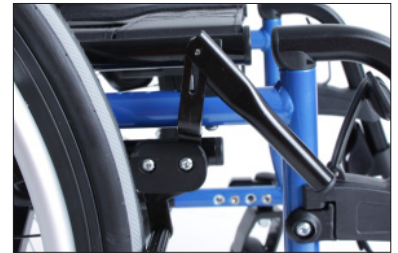
MH10 Prolongamento do manípulo de travão