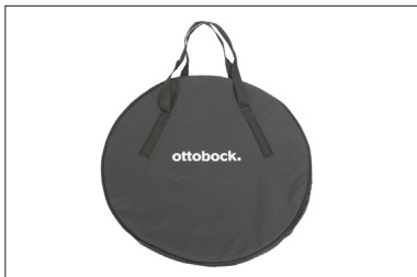
MZ58 Bolsa para rodas traseiras