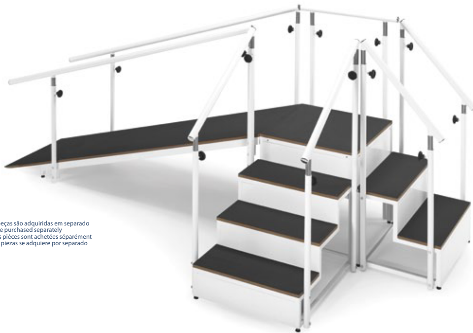
Imagem de conjunto. As peças são adquiridas em separado / Image of the set. Parts are purchased separately / Image de l'ensemble. Les pièces sont achetées séparément / Imagen de conjunto. Las piezas se adquiere por separado