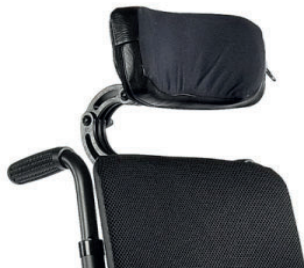
ZIP030416 Apoio de cabeça