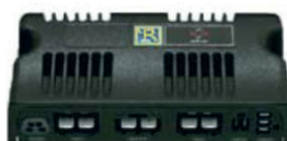
ZIP110004 Caixa de control 120 Amp