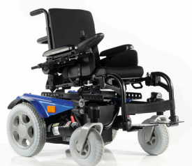
Foto com acessórios