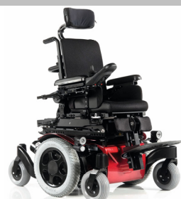
Foto com acessórios