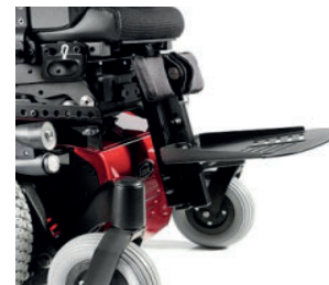
ZIP050038 Apoios de Pés Central