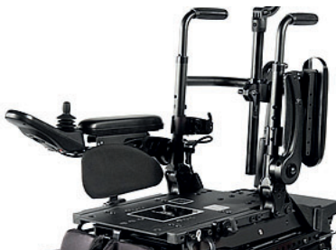
ZIP040122 Apios de braços standard