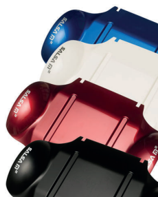
Cores Zippie Salsa M2