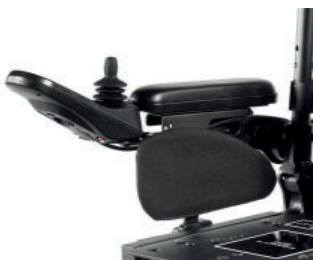
ZIP040142 Protectores laterais