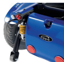
● ● ● Cores Zippie Salsa R2