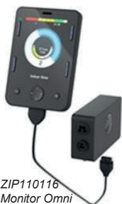
ZIP110116 Monitor Omni