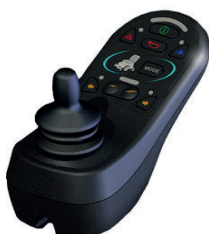
ZIP110016 Comando R-net para Luzes e Indicadores