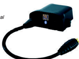
SAL090068 Módulo para Bluetooth