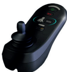
ZIP110015 Comando R-net básico