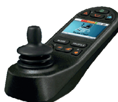
ZIP110017 Comando R-Net com monitores a cores