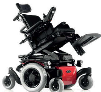
SAL130004 Basculação eléctrica