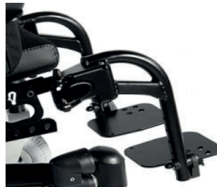
ZIP050035 Apoios de pés abatíveis a 90°