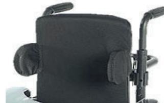
ZIP030004 Suportes laterais