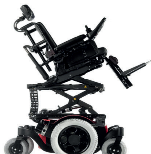
SAL130006 Elevação e basculação eléctrica