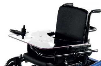
SAL090040 Mesa-bandeja abatível