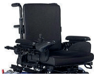
Assento e encosto Jay Comfort