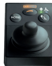
Comando para acompanhante