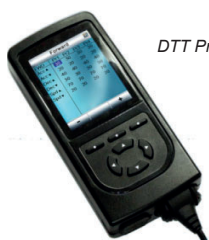
DTT Programador manual