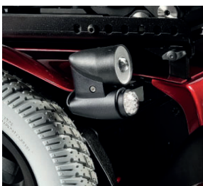
SAL110201 Luzes de LED's