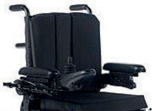
ZIP030301 Tecido de encosto Standard