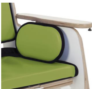
Estofa pélvico almofadado