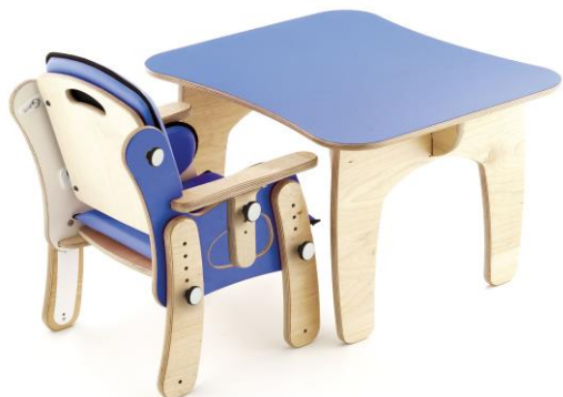
Mesa PAL 2 pessoas