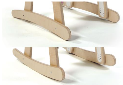
Perna com suporte fixo/baloiço