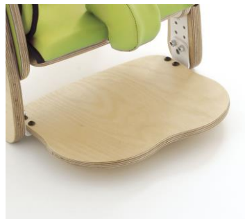
Placa para pés